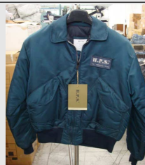
Bomber CWV45-P Vintage H.P.S.